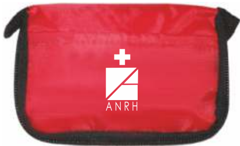
Trousse de premiers secours