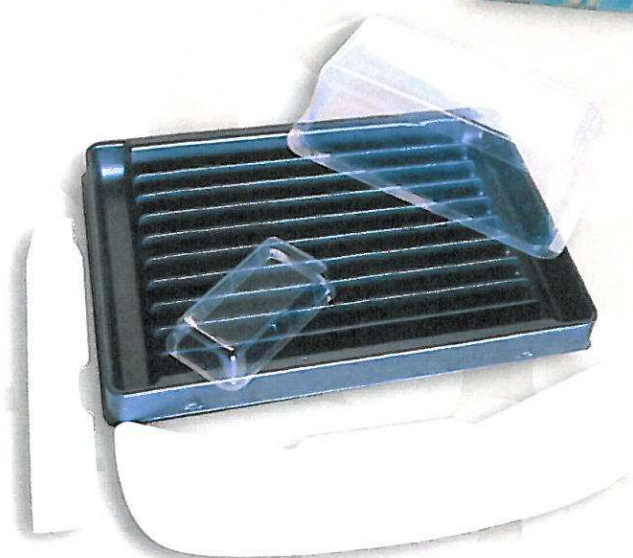
Découpe de coque thermoformée