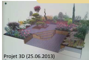
Projet 3D (25.06.2013)