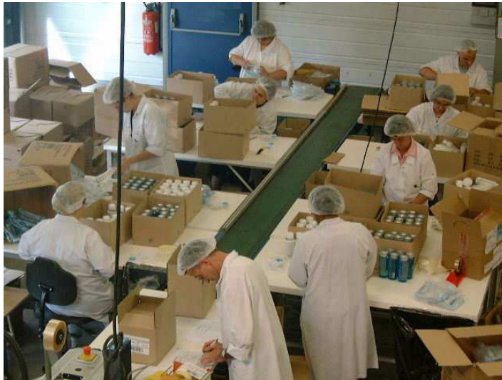
Ateliers de production