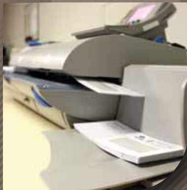
Mise sous pli