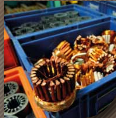
Valorisation des déchets