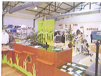
La repasserie - Pressing Ecologique

Une Blanchisserie Industrielle où nous traitons 3 tonnes/ jour de linge avec un équipement ultra-moderne et performant