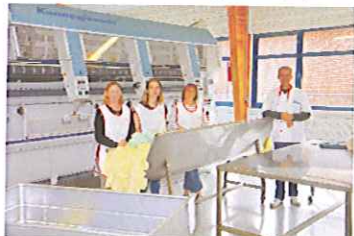
La blanchisserie industrielle

Une Repasserie et Pressing Ecologique «L'Affaire à Repasser» au centre ville de Dieppe qui offre un service de qualité à plus de 800 clients réguliers