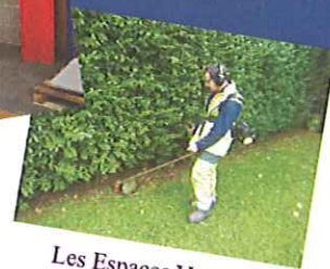
Les Espaces Verts