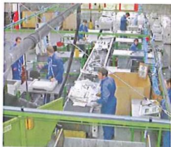
Démantèlement de matériels électriques

Le Laboratoire de production du Caramel de Pommes Dieppoises fabrication selon la réglementation HACCP et commercialisation dans plusieurs filières de distribution (GMS, épicerie fines, Offices du Tourisme...)