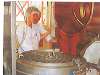
Le Caramel de Pommes Dieppoises