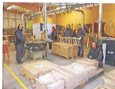
L'Atelier Bois Solidaire

Des activités éducatives d'ouverture culturelle, sportive, artistique, pédagogique ainsi qu'un accompagnement psychologique et social sont proposés pour développer l'autonomie et l'intégration vers le milieu ordinaire.