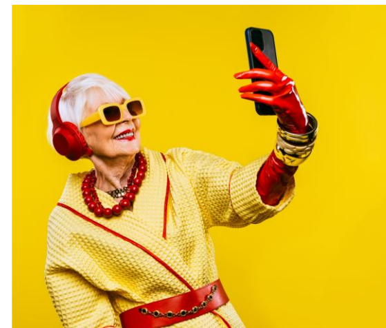
Offre de services « Retraite »