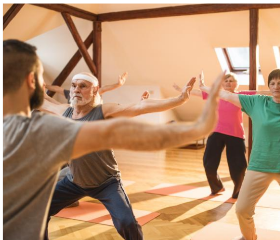
Offre de services « Service social »